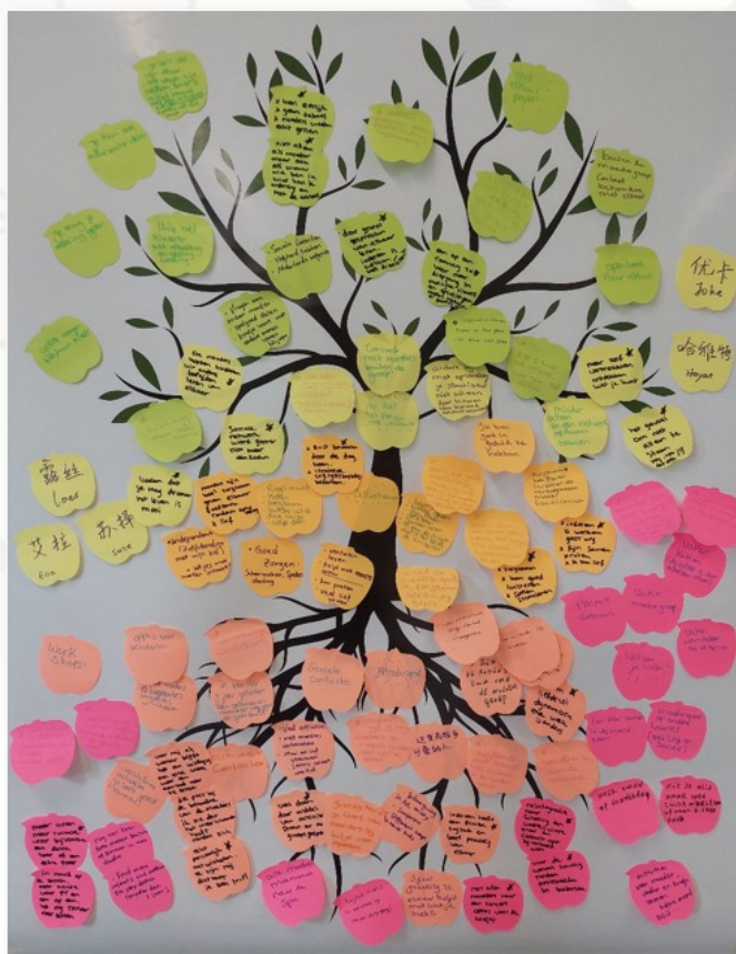
Met deze boom hebben ouders hun ideeën met elkaar gedeeld